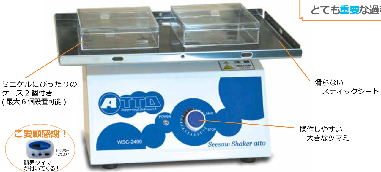
WSC-2400 SeesawShaker atto