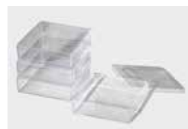
スチロールケース