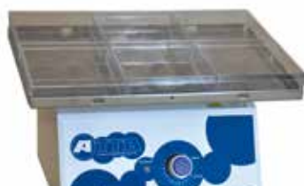
ケース 6 個設置例