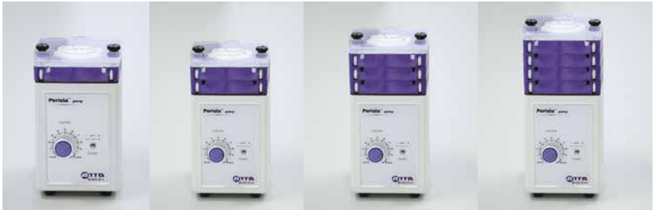
SJ-1211 II -L (1 流路)