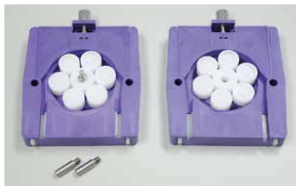
左: カセット(B)部一式(中段)ペリスタ I / II 用 右: カセット(A)部一式(中段)ペリスタ I / II 用 下: 固定スタッド(ねじ)