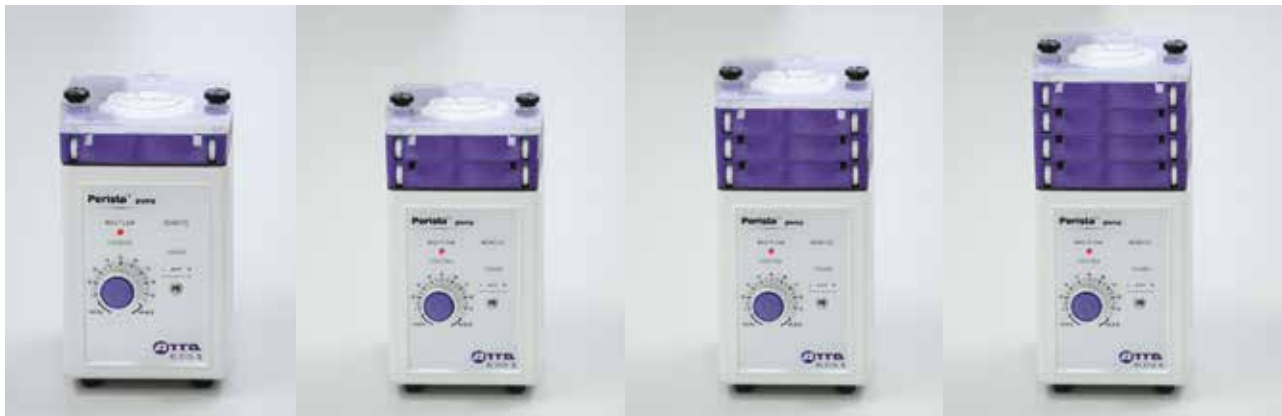
AC-2110 II (1 流路)